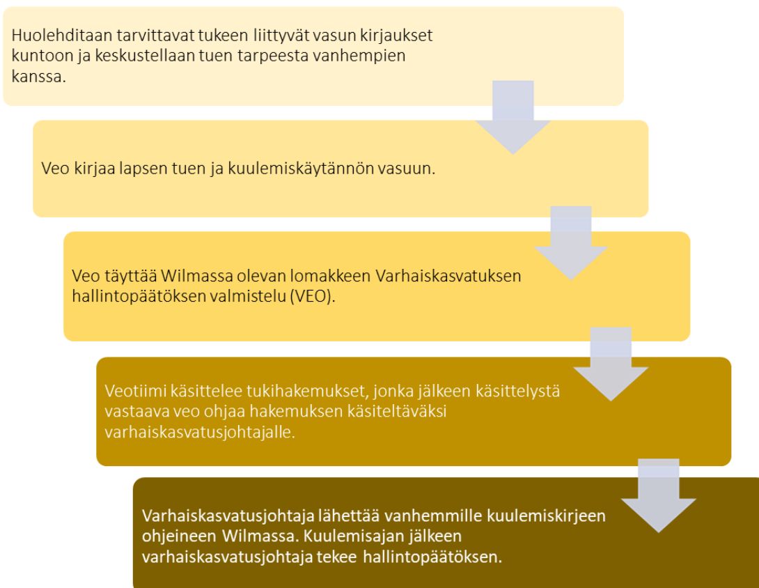
Kuvio 2. Ruskon varhaiskasvatuksen hallintopäätösprosessi