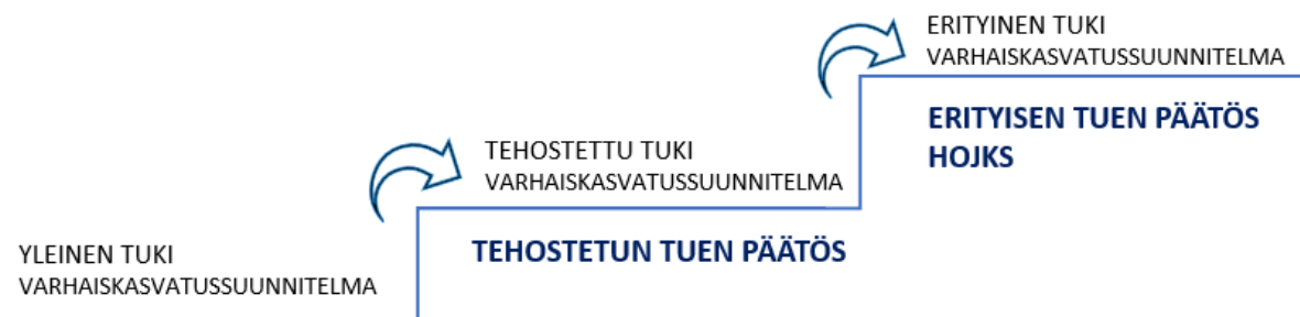
Kuvio 1. Tuen tasot varhaiskasvatuksessa. (YLLÄ OLEVA KUVIO POIS, KORVAUTUU ALAPUOLELLA OLEVALLA KUVIOLLA)

Kaikkia huoltajia tiedotetaan varhaiskasvatussuunnitelmasta ja Ruskon kunnassa olevista käytänteistä ja tukimuodoista vanhempainilloissa, tiedotteissa ja kunnan nettisivuilla. Yksittäisen lapsen tukimuodoista keskustellaan yhteistyössä huoltajien kanssa. Yleisen tuen tukipalveluista ja apuvälineistä sekä tehostettuun ja erityiseen tukeen siirtämisestä tukipalveluineen ja apuvälineineen hallintopäätöksen tekee varhaiskasvatusjohtaja. Pidennetyn oppivelvollisuuden päätöksen tekee johtava rehtori. Palveluiden ja apuvälineiden tarve kuvataan lapsen varhaiskasvatussuunnitelmassa. (tai HOJKS:ssa).